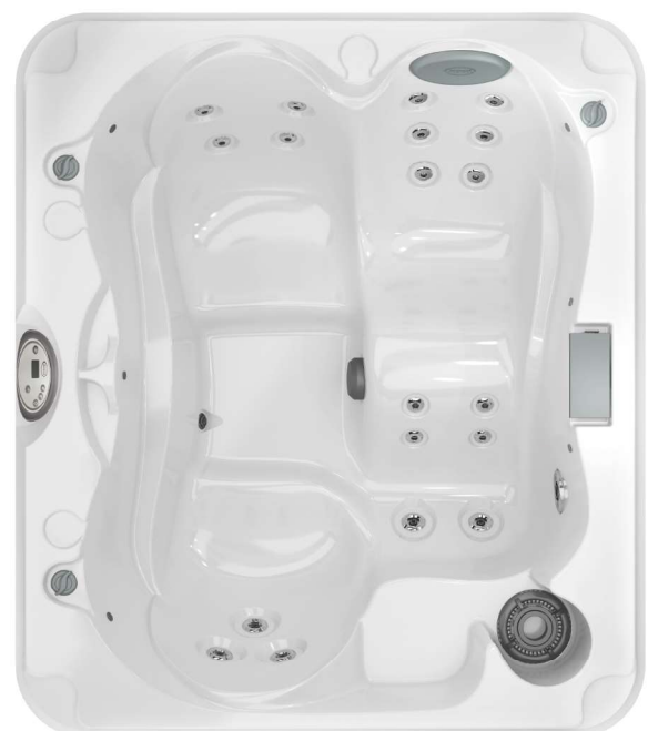
193 x 168 x 81 cm