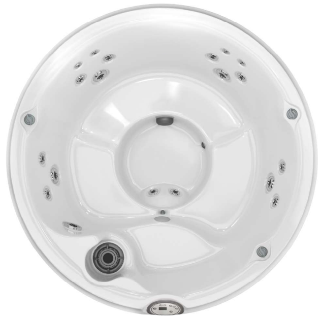
Ø198 x 92 cm