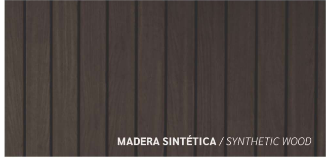
MADERA SINTÉTICA / SYNTHETIC WOOD