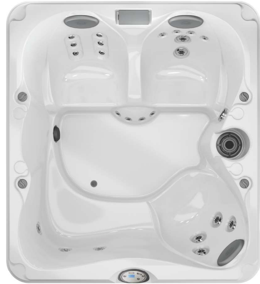
193 x 213 x 87 cm