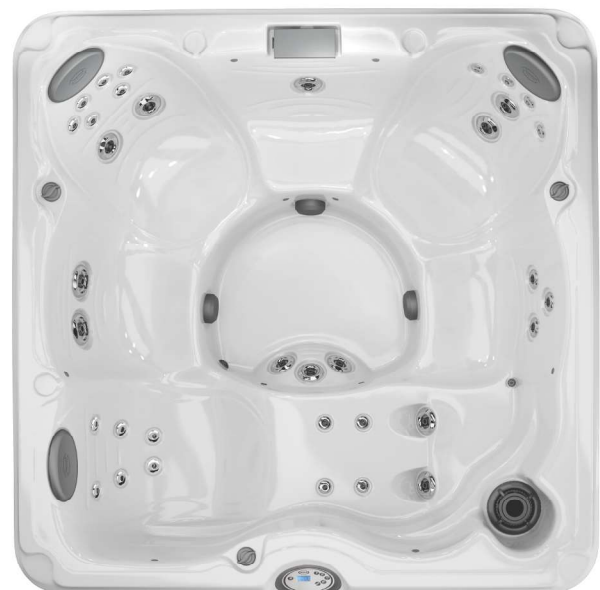
214 x 214 x 92 cm